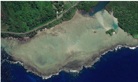
图 3 位于瓦努阿岛南岸萨武萨武附近的珊瑚礁海岸影像