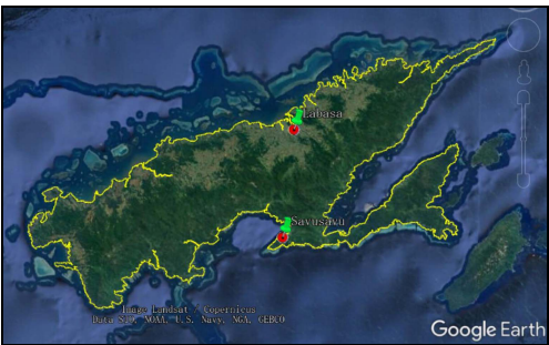
图 2 瓦努阿岛数据可视化图(.kmz 格式)