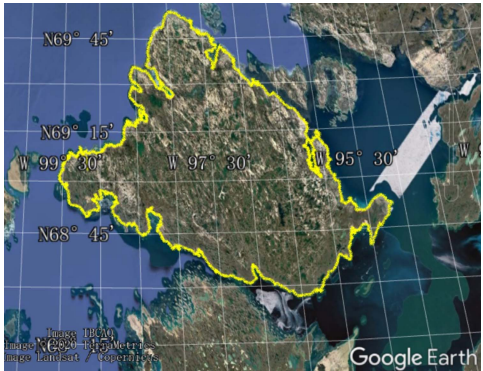
图 2 威廉王岛数据可视化图（.kmz 格式）