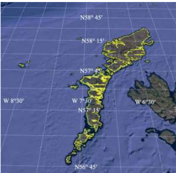
图 2 外赫布里底群岛数据可视化图（.kmz 格式）

外赫布里底群岛主要由刘易斯-哈里斯岛（Lewis and Harris）、北尤伊斯特岛（North Uist）、南尤伊斯特岛（South Uist）、本贝丘拉岛（Benbecula）和巴拉-瓦特赛岛（Barra-Vatersay）等岛屿组成，面积大于 25 m 2 的岛屿共计 2,413 个 [7] 。刘易斯-哈里斯岛是群岛中最大的岛屿，其面积为 2,169.36 km 2 ，海岸线长 934.16 km。北尤伊斯特岛在西南和北面分别与巴利谢尔岛（Baleshare）和伯纳雷岛（Berneray）以人工修筑的砾石堤坝相连接。本贝丘拉岛在南北两面分别与艾伦娜切亚拉布哈基岛（Eileann Chearabhaigh）和弗洛代格岛（Flodaigh）以人工修筑的砾石堤坝相连接。外赫布里底群岛中其他主要岛屿还包括：大伯纳拉岛（Great Bernera）、格里姆萨-罗内岛（Grimsay-Ronay）、塔伦赛岛（Taransay）、斯卡普岛（Scarp）、帕贝岛（Pabbay）、斯卡尔佩岛（Isle of Scalpay）、埃里斯凯岛（Eriskay）、赫塔岛（Hirta）、明古莱岛（Mingulay）、桑德雷岛（Sandray）、威艾岛（Wiay）、瓦洛伊岛（Vallay）、大塞恩岛（Ceann Ear）、博雷岛（Boreray）、锡福斯岛（Seaforth）、帕贝岛（Pabbay）、弗代岛（Fuday）、巴拉海岛（Barra Head）、恩赛岛（Ensay）、柯基博斯特岛（Kirkbost）、基勒拉岛（Killegray）、小塞恩岛（Ceann Iar）、加布岛（Garbh Eilean）、赫利赛岛（Hellisay）、盖尔拉格莫尔岛（Ceallasaigh Mor-Beag）、艾伦刘伯海里特（Eilean Iubhard）、米拉斯塔岛（Mealasta）、小伯纳拉岛（Little Bernera）、北罗纳岛（North Rona）、索厄岛（Soay）、吉格哈岛（Gighay）、斯托马岛（Stromay）和帕拜格莫尔岛（Pabaigh Mor）等（表 1）。群岛的总面积为 3,184.85 km 2 ，海岸线总长度为 3,401.72 km。