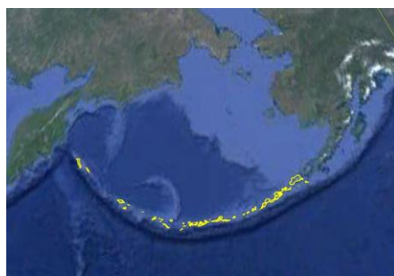
图 1 阿留申群岛数据图 (.kmz 格式截图)

面积大于 10 km 2 的岛屿有 49 个, 面积大于 100 km 2 的岛屿有 24 个。最大的岛屿乌尼马克岛面积为 4,077.93 km 2 ; 第二大岛是乌纳拉斯卡岛, 面积 2,724.71 km 2 , 海岸线 1,063.46 km。